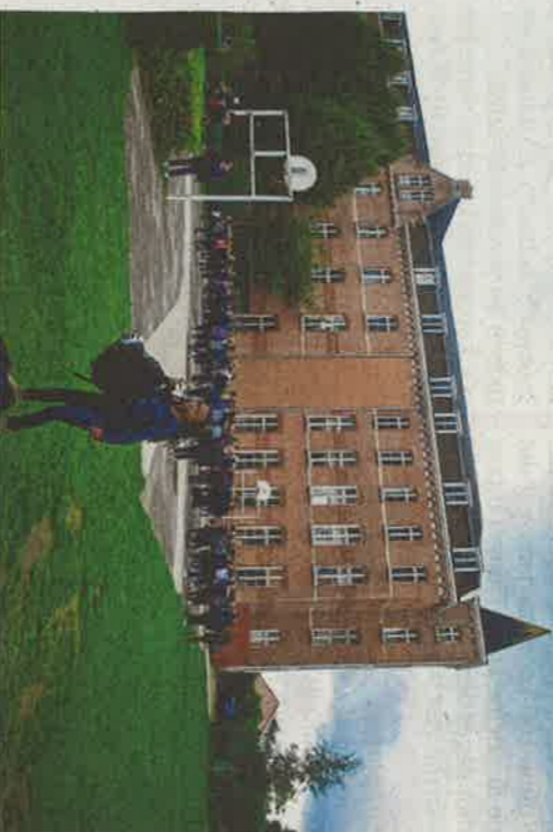
Blok 2 van het Sint-Jozefinstituut zal gesloopt worden wanneer de nieuwbouw klaar is.